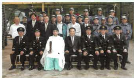
五城分団第2部入団式 平成30年5月19日

今後、火災や自然災害等の災害が発生した時には分団の方針を基に地域住民の方や消防署の方と協力して対処していきけるように分団全員で精進してまいります。