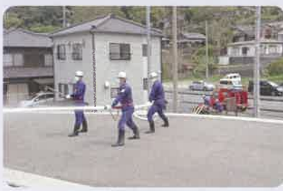
長浜分団による放水訓練の様子

今後、日々の訓練に励み、火災・災害現場において「急がず、慌てず、騒がず」の冷静さをもって消防団活動にあたりたいと思います。