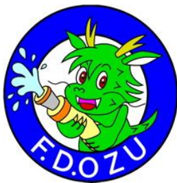
大洲地区消防本部 マスコットキャラクター 「りゅうじんくん」

このマスコットキャラクターは、地域の象徴である肱川の龍神伝説や、江戸時代に大洲を治めた大名家の家紋等を取り入れたもので、一般公募し応募のあった多数の作品の中から選ばれました。(平成11年4月1日)